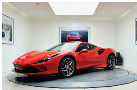
Ferrari F8 Tributo

Année : 2023 Km : 1 640 Couleur extérieure : Rosso Corsa