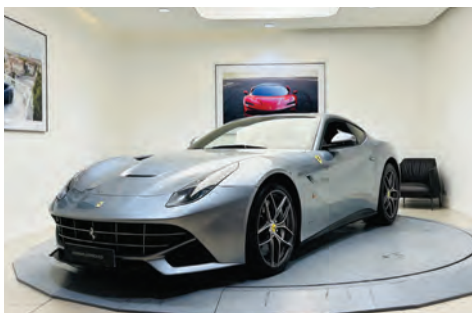
Ferrari F12 Berlinetta

Année : 2020 Km : 8 044 Couleur extérieure : Rosso Scuderia