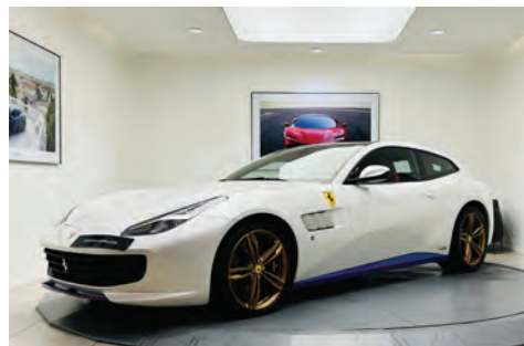
Ferrari GTC4 Lusso

Année : 2021 Km : 2 252 Couleur extérieure : Grigio Ferro Metall