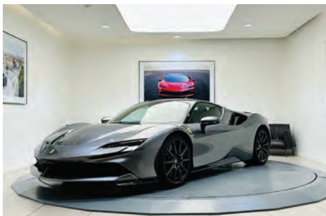
Ferrari SF90 Stradale Assetto Fiorano

Année : 2011 Km : 63 367 Couleur extérieure : Grigio Abu Dhabi