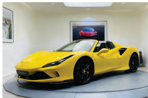
Ferrari F8 Spider

Année : 2015 Km : 27 553 Couleur extérieure : Grigio Titanio Metall