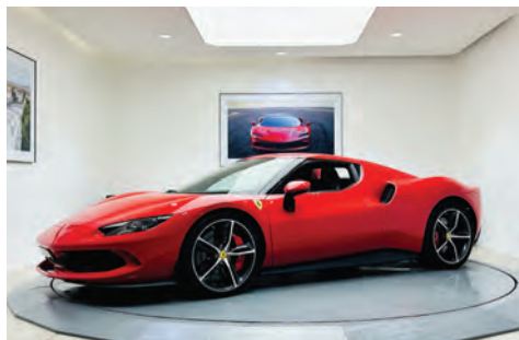
Ferrari 296 GTB

92 Route de Castres 31130 Balma Tél. 05 61 54 14 14 toulouse.ferraridealers.com