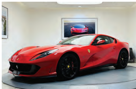
Ferrari 812 Superfast

Année : 2018 Km : 7 855 Couleur extérieure : Bianco Italia