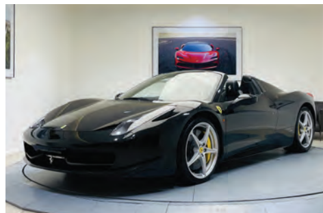
Ferrari 458 Spider

Année : 2018 Km : 15 772 Couleur extérieure : Rosso Corsa