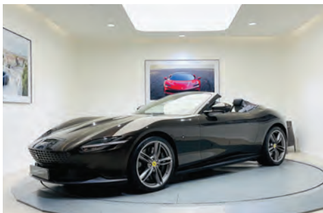
Ferrari Roma Spider

Année : 2022 Km : 5 628 Couleur extérieure : Rosso Corsa